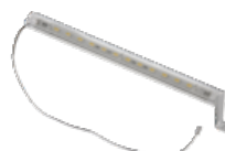
Lumi+ Luce ausiliaria a LED 7041V000