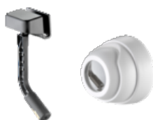
Laser Laser segnalatore di parcheggio 10378