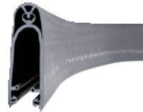
Costa di sicurezza elettrica 8,2 kOhm (A 85 mm)