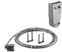
Tappo terminale (A 85 mm)